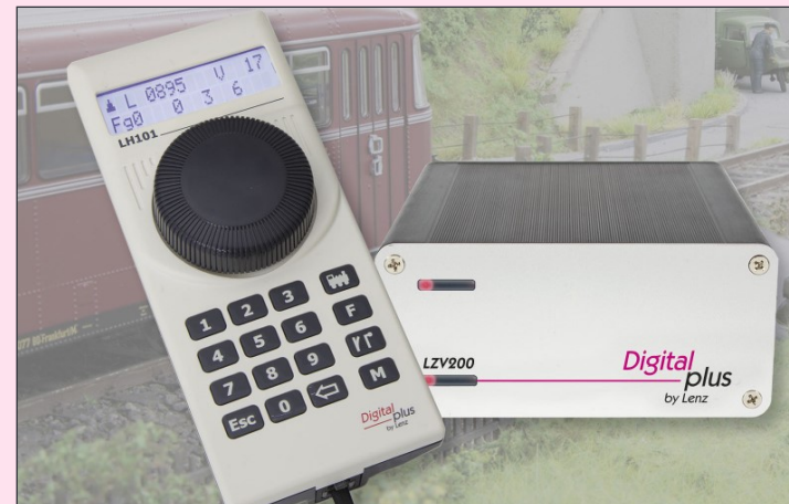
60101 SET101 Einsteigerset mit LZV200 und LH101

und Mehrfachtraktion sind komfortabel einrichtbar. Bis zu 2048 Weichen, Signale und andere Zubehörartikel sind schaltbar, im Handregler können Weichenstraßen abgelegt werden. Einstellungen an Lokdecodern können per PoM oder auf dem Programmiergleis vorgenommen werden. Die LZV200 stellt einen maximalen Strom von 5A zur Verfügung, bei Bedarf kann mit weiteren Verstärkern LV103 erweitert werden.