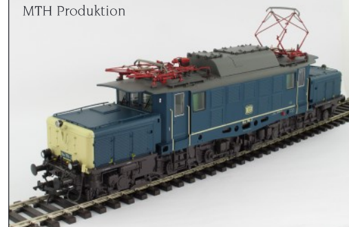
Abbildung zeigt eine E94 aus MTH Produktion