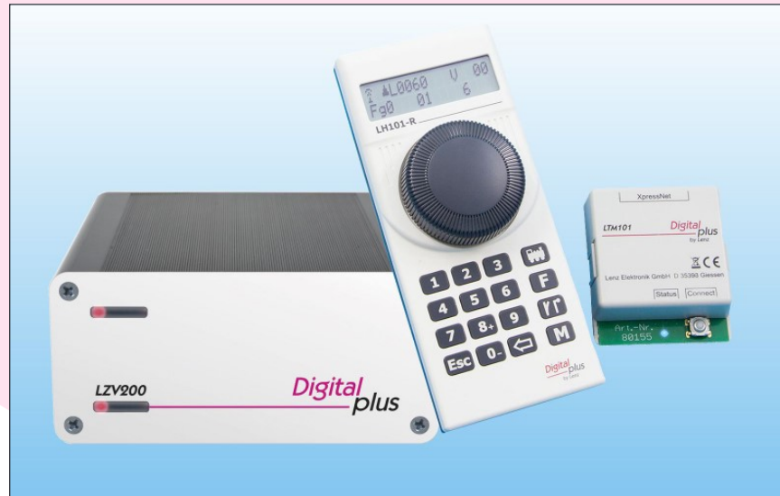
60103 SET101-R Einsteigerset mit LZV200, LH101-R, LTM101

besteht aus der Zentralen-Verstärker-Kombination LZV200 und dem Funkhandregler LH101-R.